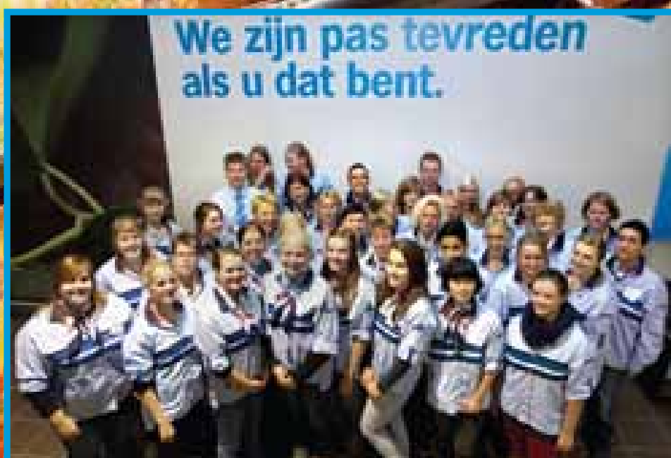
Uw team Verkoopafhandeling