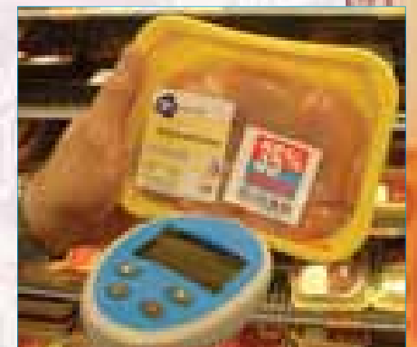
Stap 4: Scan bij producten met 35% korting alleen de code op de kortingssticker. De korting is dan meteen verrekend.