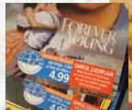
Stap 6: U kunt bij het afrekenen bij een betaalpaal ook Air Miles verzilveren.