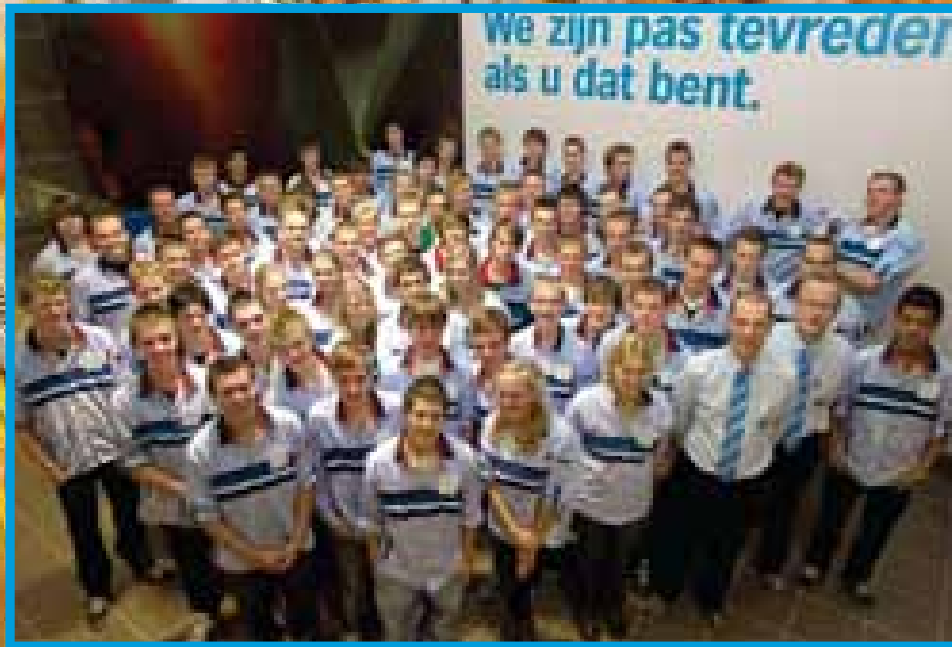
Uw team Verkoopklaar