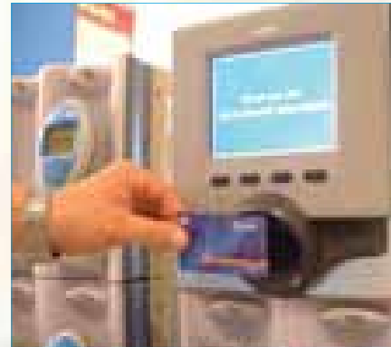
Stap 1: Ga naar het meubel met de handscanners en houd uw AH Bonuskaart voor de scanner.

Zelfscannen betekent sneller en efficiënter boodschappen doen. Bent u er nog niet aan toe, dan kunt u altijd terecht bij de acht vaste kassa's en de twee kassa's bij de servicebalie. “Uiteraard staan onze medewerkers altijd klaar om u een handje te helpen bij het zelfscannen en hebben we een folder waarin alles duidelijk staat uitgelegd.”