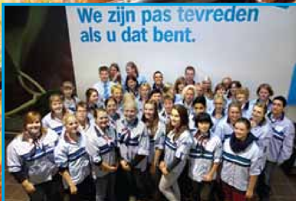
Uw team Verkoopafhandeling