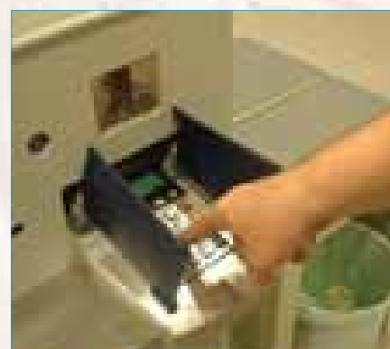
Stap 9: Reken af met pin of chip.