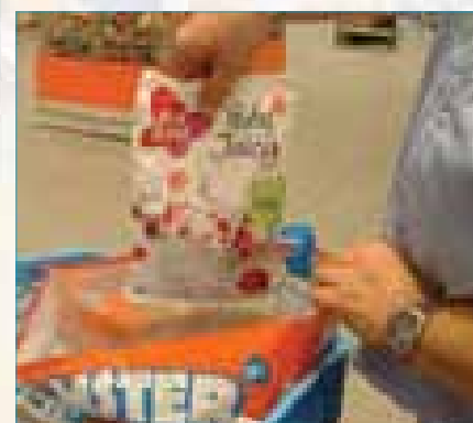
Stap 5: U kunt tijdens het scannen meteen uw boodschappen inpakken.