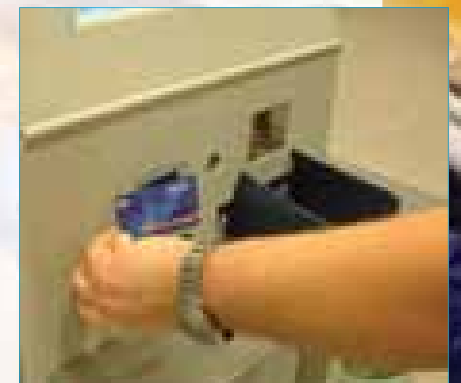
Stap 8: Scan uw AH Bonuskaart bij de betaalpaal.