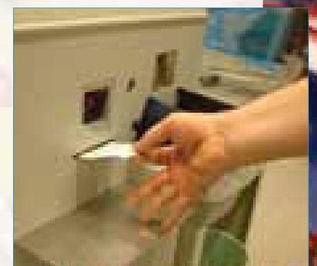
Stap 10: Vergeet niet uw betaalbon met eventueel een beltegoedbon en/of een entreebewijs.