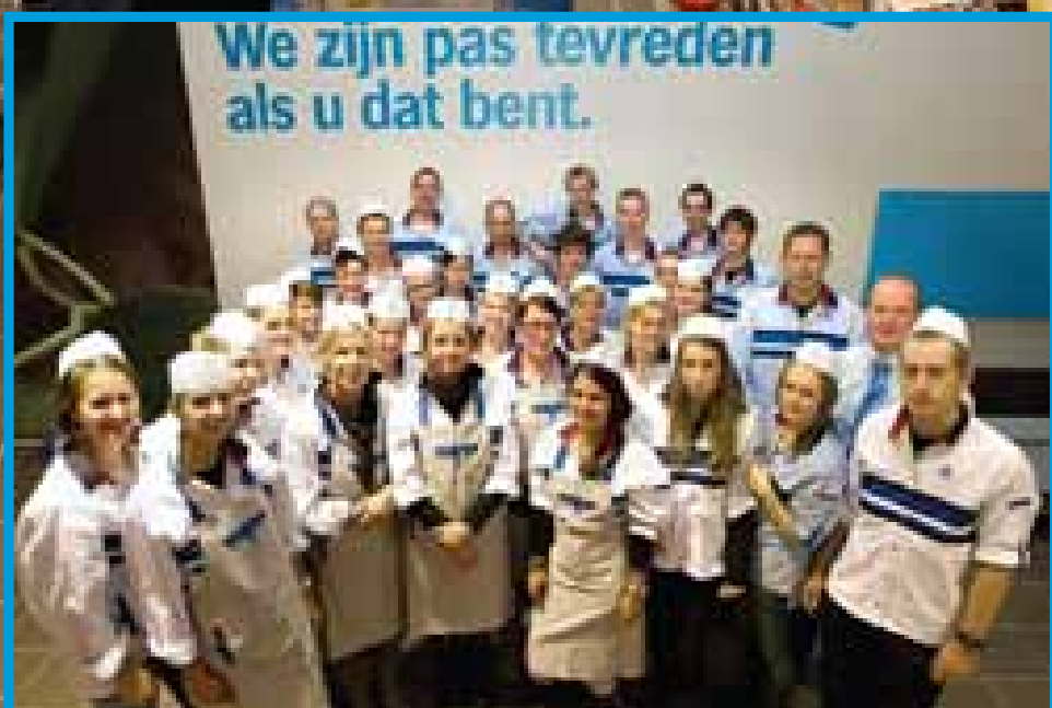
Uw team Verkoop