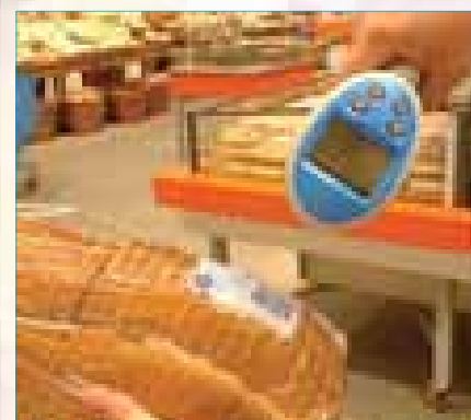
Stap 3: Scan de streepjescodes van uw boodschappen door de gele knop van de handscanner in te drukken.