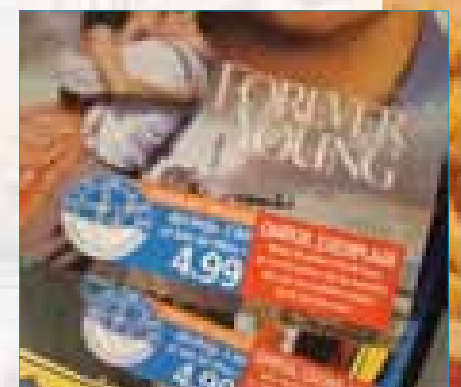
Stap 6: U kunt bij het afrekenen bij een betaalpaal ook Air Miles verzilveren.