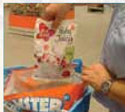
Stap 5: U kunt tijdens het scannen meteen uw boodschappen inpakken.