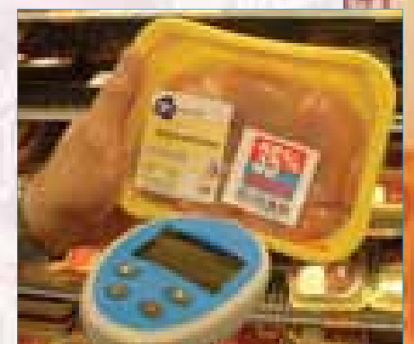
Stap 4: Scan bij producten met 35% korting alleen de code op de kortingssticker. De korting is dan meteen verrekend.