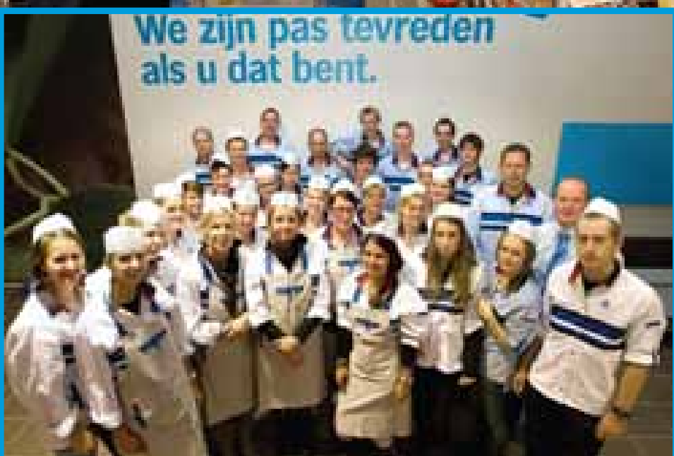
Uw team Verkoop