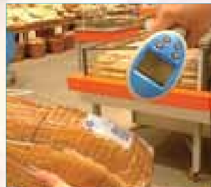
Stap 3: Scan de streepjescodes van uw boodschappen door de gele knop van de handscanner in te drukken.